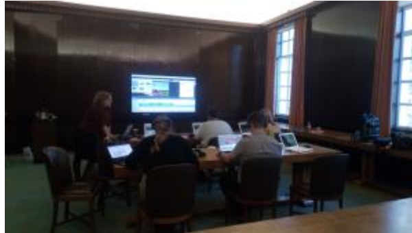
7 - Digital Story Telling Training