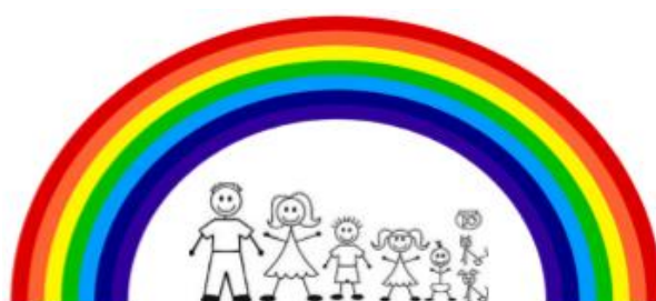
1 - Ngymuned Plant Gorllewin Sandfields

Cefnogi plant yn eu blynyddoedd cynnar, yn enwedig plant mewn perygl o brofiadau niweidiol yn ystod plentyndod